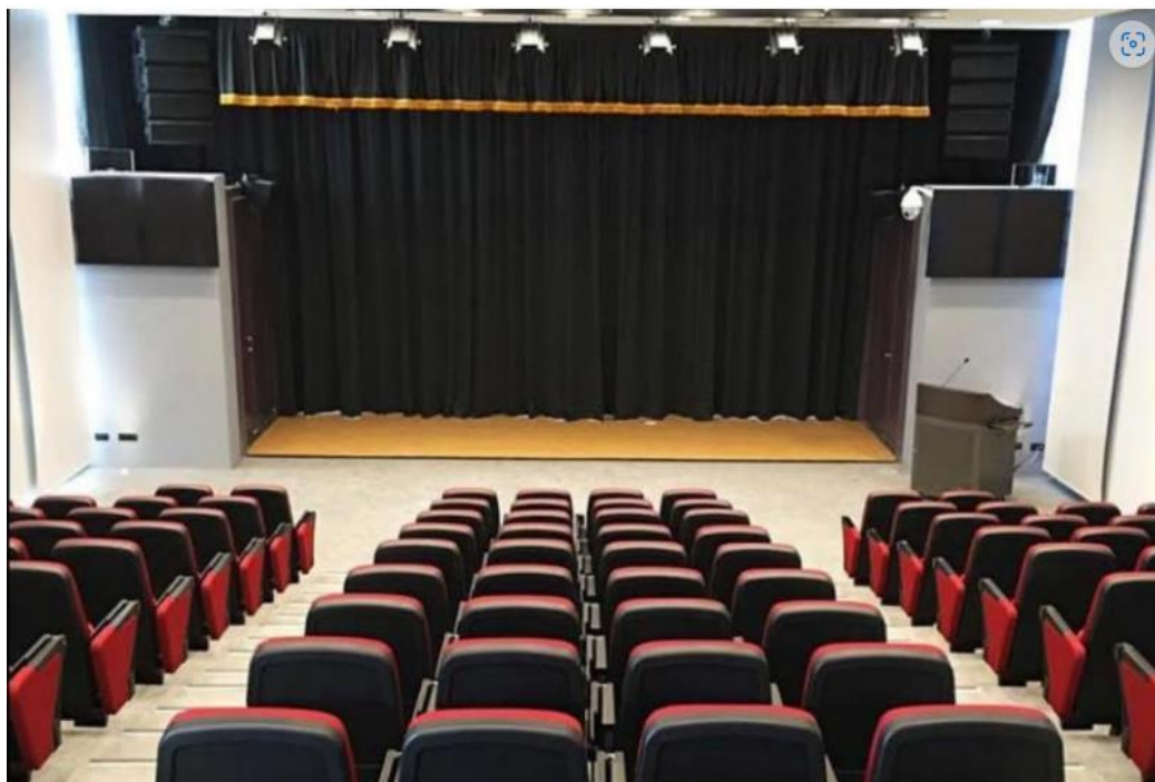
願景館2F-國際演講廳