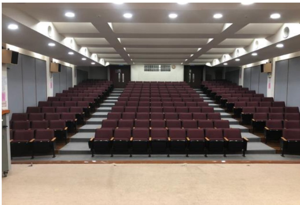
學生活動中心-405演講廳

國立臺北教育大學 National Taipei University of Education