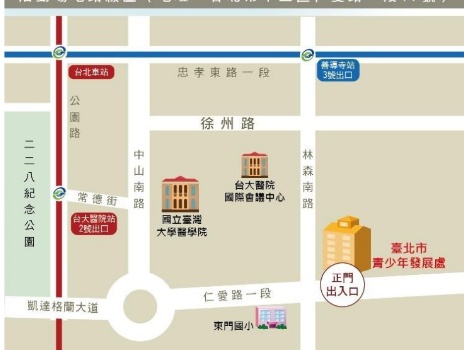
活動場地路線圖 (地址：台北市中正區仁愛路一段 17 號)