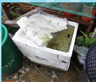
03 保麗龍盒、紙盒、餅乾盒