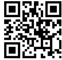
報名 QR code